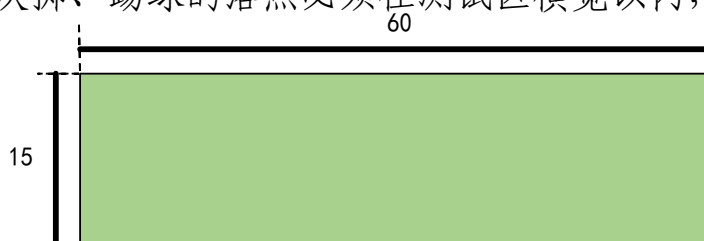
图 3 守门员抛远与踢远场地

考试方法：如图 3 所示，在球场适当位置画一条 15 米线段作为测试区横宽，从横线两端分别向场内垂直画两条 60 米以上平行直线作为测试区纵长，标出距离数。考生站在起点线后，先将球以手掷远 3 次（允许带手套进行），然后用脚踢远 3 次（采用踢凌空球、反弹球、定位球等方法不限），各取其中最好一次成绩相加为最终成绩。每次掷、踢球的落点必须在测试区横宽以内，否则不计成绩。